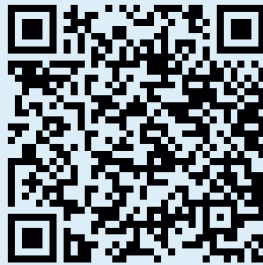
Video: Kapselbergung https://capsovision.com/international/patient-resources/what-to-expect-with-capsocam/

Die Größe der Kapsel entspricht einer großen Tablette (z.B. Antibiotika). Durchmesser 1,1 cm, Länge 3,1 cm, Gewicht 4 Gramm. Normalerweise wird die Kapsel etwa 3 bis 30 Stunden (selten nach bis zu 72 Std.) nach dem Schlucken wieder ausgeschieden. Der QR-Code führt Sie zu einer Seite mit helfenden Erklärvideos (in verschiedenen Sprachen) zur Bergung der Kapsel.